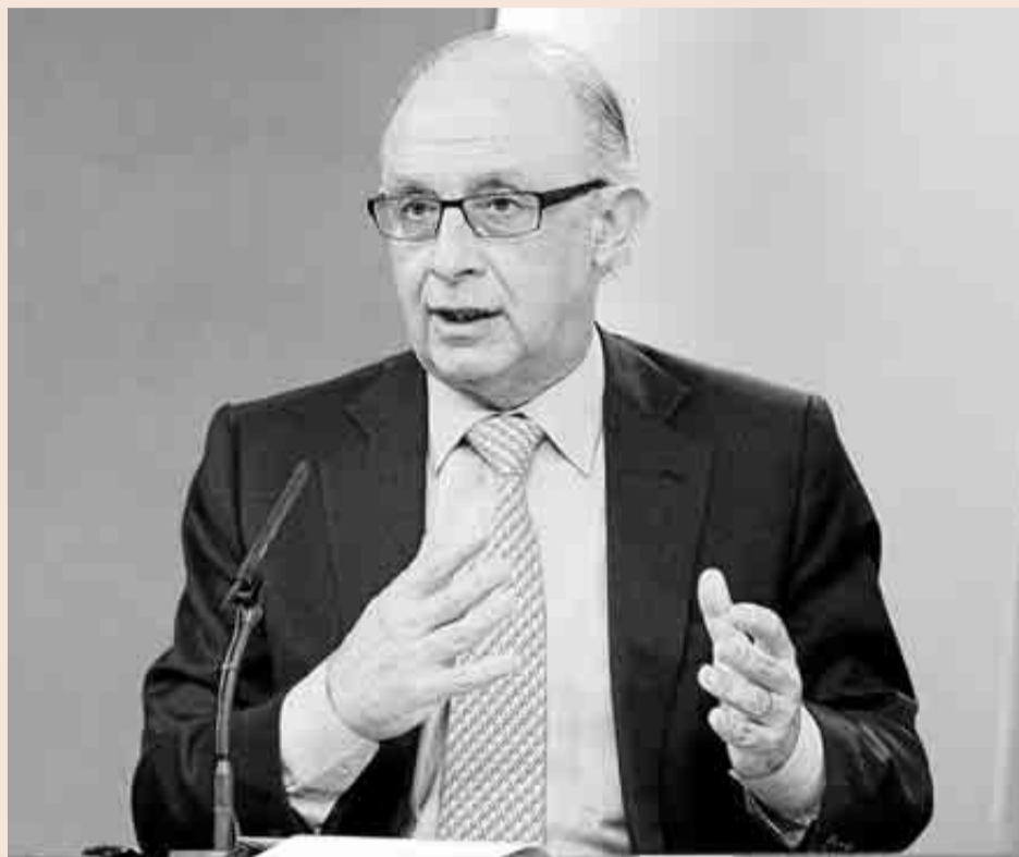
Cristóbal Montoro, ministro de Hacienda.

que el Gobierno quiere que la contratación de servicios domésticos desgrave en el IRPF para incentivar el aflujo de economía sumergida. Esta medida, que llevaría a empleadas del hogar, médicos a domicilio, cuidadores, fontaneros, pintores o albañiles a utilizar factura se enmarcaría dentro del plan de Hacienda de mejoras en la tributación