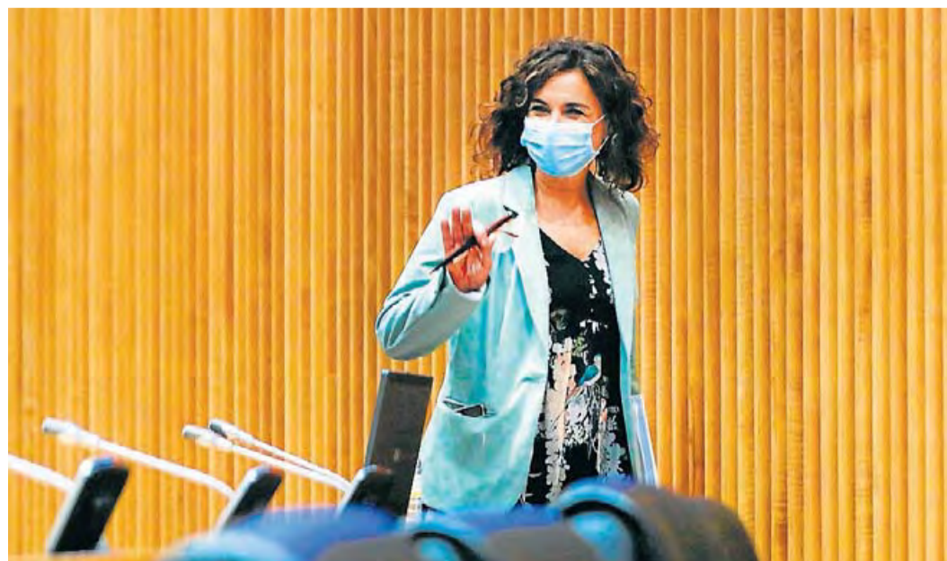
La ministra d'Hisenda, María Jesús Montero, ahir.

Per a l'any que ve l'assignació dels pressupostos serà de 8,4 milions d'euros, un 6,9% més del que tenia aquest any. Amb aquesta pujada, de fet, recupera el nivell del 2011, quan van començar les retallades, que van seguir el 2012 i 2013. Després de la dotació s'havia congelat. Aquest 2020 la Casa del Rei havia tingut una assignació pressupostària de 7,9 milions d'euros.