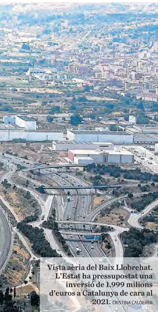
Vista aèria del Baix Llobregat. L'Estat ha pressupostat una inversió de 1.999 milions d'euros a Catalunya de cara al 2021. CRISTINA CALDERER

en les negociacions del pressupost de la Unió Europea. "És obscè sentir a dir que no hi ha diners per a la sanitat, el clima i l'ocupació quan els mercats financers no havien tingut mai tan bona salut", va escriure el polític al seu compte de Twitter.