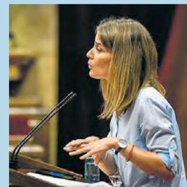
Jéssica Albiach, presidenta de Podem al Parlament.

La presidenta de la Comissió Europea, Ursula von der Leyen, va assegurar ahir que "mentre el virus continuï rondant" encara no és el moment de retirar les ajudes. Per ajudes, Brussel·les entén tots els plans de suport públic que els governs han estat impulsant des que tenen barra lliure de despesa, com ara el finançament d'ERTO, els ajuts diversos a famílies i els avals per a les empreses amb dificultats. Els governs ja han començat a sol·licitar els préstecs barats de l'Eurogrup per finançar els ERTO i Von der Leyen insisteix en aprovar nous impostos.