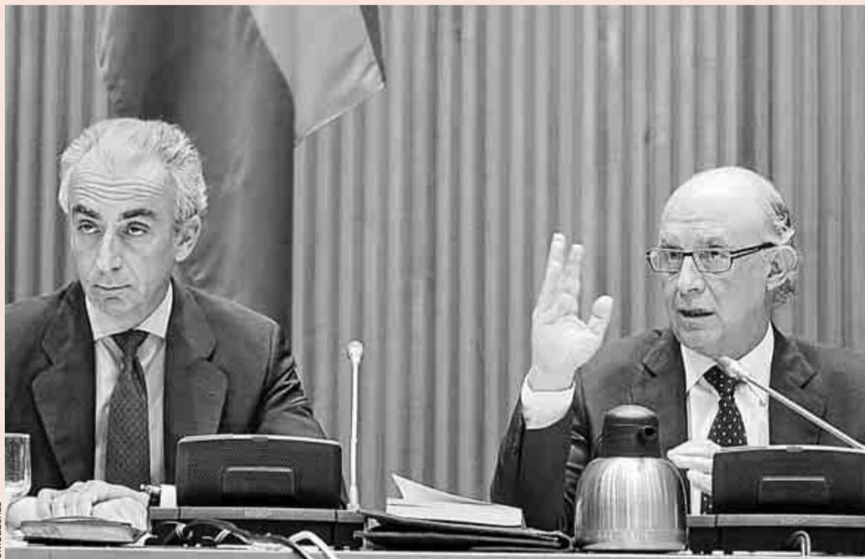
El secretario de Estado de Hacienda, Miguel Ferre, y el ministro de Hacienda, Cristóbal Montoro.

Los beneficios fiscales de años pasados cifraban el incentivo en cerca de 1.000 millones